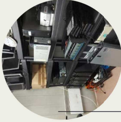
Espace de travail